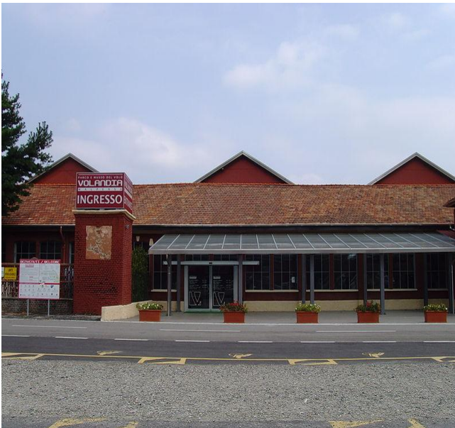
nella foto: Ingresso di Volandia

Partendo da Malpensa la prima tappa è a Volandia – museo che testimonia quanto il settore aeronautico, attraverso la Caproni, l'Augusta e l'Aermacchi, abbia rappresentato uno dei punti di forza del manifatturiero italiano.